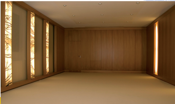
Meditationsraum der KHG Regensburg

Er ist Jesuit, Theologe und Physiker. Er lehrt Philosophie an der Hochschule für Philosophie in München.